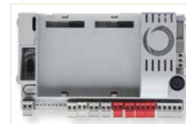
Mainboard logica 14A