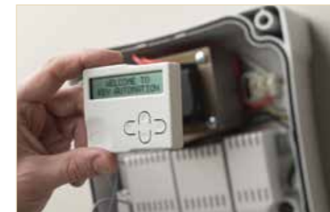
Centrale 2 motori 24V in box