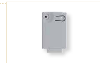
Ricevente ad innesto 4CH per 14A