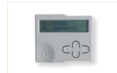
Modulo display per 14A