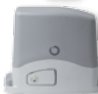
SC4224 400 kg