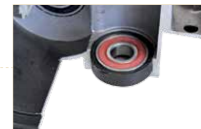
Utilizzo di cuscinetti a sfera di qualità