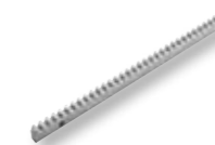
CREM-8 Cremagliera M4 zincata 30x8 mm L = 1000 mm