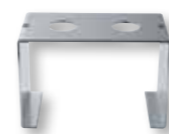
CPHSC-50 Contropiastra di fissaggio rialzata