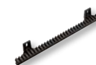
CREM-P Cremagliera M4 in nylon L = 1000 mm per cancelli fino a 800 kg