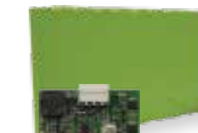
KBPKN2 Batterie 24 Vdc NiMH, 2,2 Ah e caricabatteria BCN. Adatta per utilizzo oltre ai 500 kg per prestazioni estreme