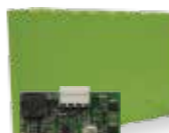
KBPKN Batterie 24 Vdc NiMH, 1,3 Ah e caricabatteria BCN. Fino a 500 kg