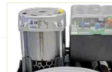
Motori robusti e prestazionali