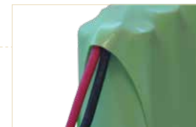
Batteria back-up opzionale a bordo