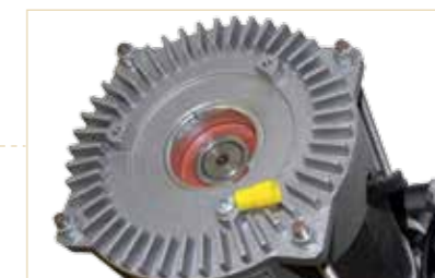
Motore robusto e prestazionale