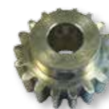
480RM6Z12 Pignone M6 Z12