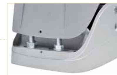
Fissaggio a scomparsa