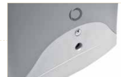
Basamento in alluminio verniciato regolabile