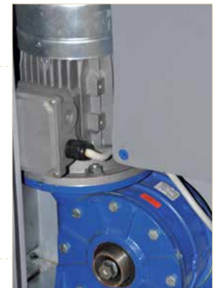
Motore robusto e prestazionale