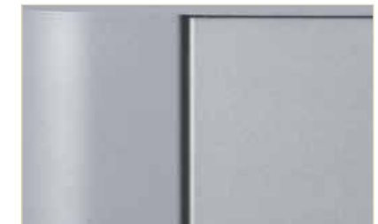
Verniciatura a polvere specifica per esterni anti-UV