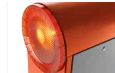
Doppio lampeggiante a led