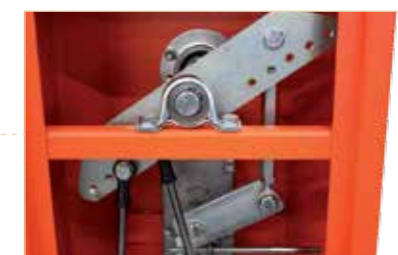
Ingranaggi di metallo + motore non in asse (resistente agli urti)