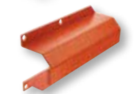
ATAST90 Attacco per asta tonda Ø 90 mm