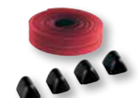
PROF6 Gomma protettiva antiurto, 12 m e tappi per AS6