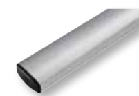
AS6 Asta in alluminio L=6000 mm dim. 100 x 40 mm