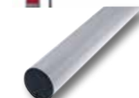
AST4 Asta tubolare in alluminio L=4000 mm Ø 60 mm, per applicazioni in caso di forte vento