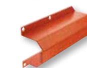
ATAST60 Attacco per asta tonda Ø 60 mm