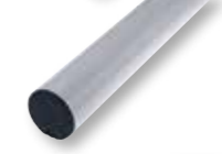
AST6 Asta tubolare in alluminio L=6000 mm Ø 90 mm, per applicazioni in caso di forte vento