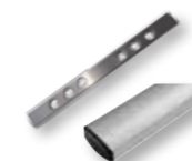
AS-4J Asta di alluminio da 2+2 m, 60X30X2 ossidato argento + giunto