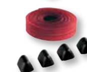
PROF Gomma protettiva antiurto, 8 m e tappi per AS4