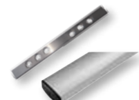
AS-6J Asta di alluminio da 3+3 m, 100X40X2 ossidato argento + giunto