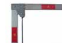
AS-SN03 Asta snodata con giunto (max L. 3 m). Solo per ALT BR4-24KP