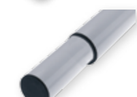
AST8 Asta tubolare telescopica in alluminio L=8500 mm Ø 60/90 mm, inclusa di contrappeso, giunto e appoggio mobile (non accessoriabile)