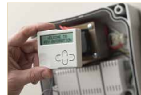
Centrale 2 moteurs 24V in box