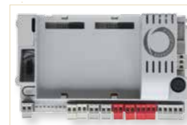
Panneau de logique principal