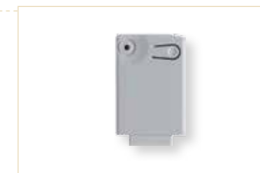
Récepteur à contact 4 canaux