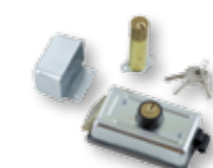
ELS-0 Gâche électrique 12 V horizontale