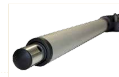
Arbre métallique solide