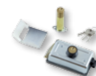
ELS-V Gâche électrique 12 V verticale