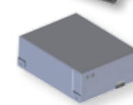
KBP (pour 14A) Kit batteries et chargeur au plomb pour 14A