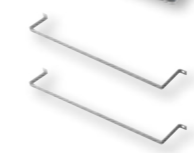
KITFIXBATT Kit de fixation de batteries 24 V (2 PCS)