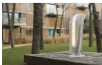
Installazione verticale su colonna

L'accensione avviene in maniera indipendente dall'automazione (con centrale 14A)