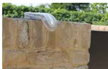
Installazione orizzontale su colonna